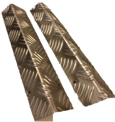
H 2st vinklar